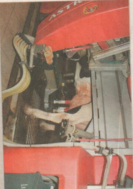
Pomocí robota se na zdejší farmě dojí už od roku 2007